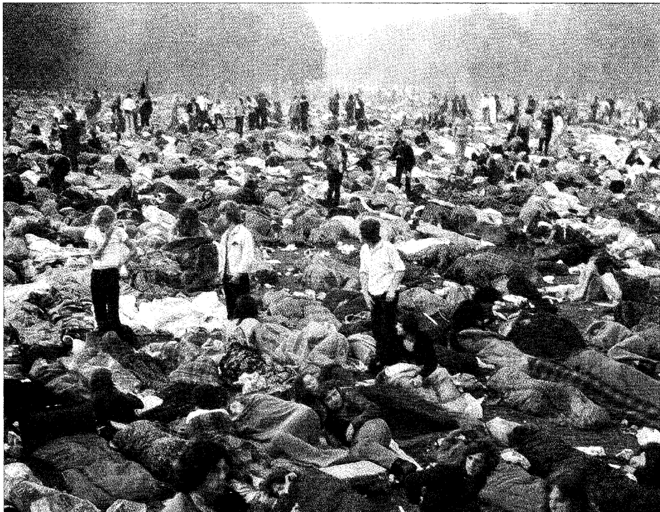
Kralingen Popfestival 1970: drie dagen lang muziek luisteren, blowen, vrijen en (heel weinig) slapen in de open lucht.